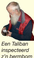
Een Taliban inspecteerd z'n bermbom